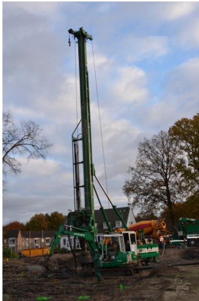
Het boren van de 'eerste' paal

In de werkgroep Bouw merken we misschien nog wel het meeste van de stroomversnelling waarin ons wooninitiatief terecht is gekomen. De laatste obstakels in het vergunningetraject zijn weggenomen nu het bezwaarschrift van omwonenden is ingetrokken na een bespreking met Glorieuxpark en vertegenwoordiging van Elysion. In onze vorige nieuwsbrief konden we melden dat de voorbereidingen van de bouw in volle gang waren.