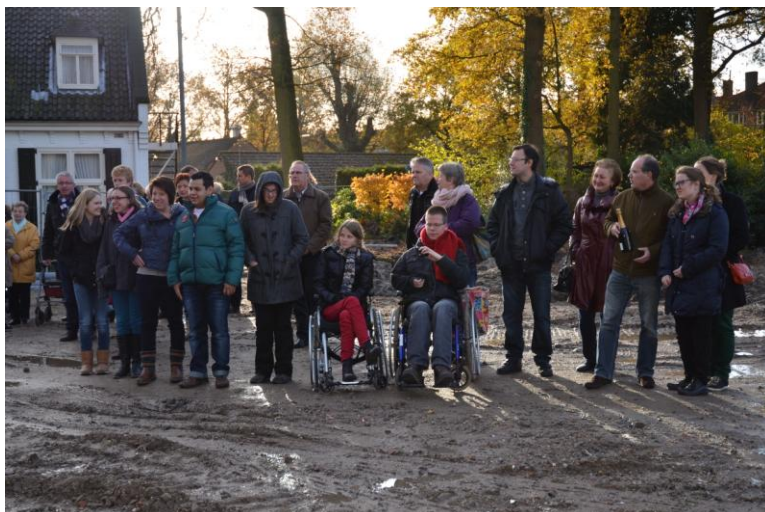
Verzamelen voor de feestelijke start van de bouw van gebouw Ronse

Regelmatig worden er activiteiten georganiseerd om van onze jongeren een hechte groep te smeden. Ze gaan een paar keer per jaar een