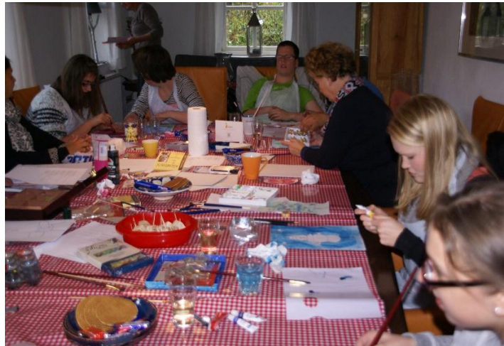
Maken van kerstkaarten; november 2013

Contact met werkgroep PR&S: info@elysion-eindhoven.nl