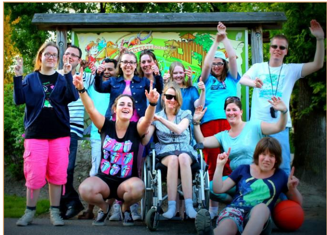
Midweek Weerterbergen; juni 2013

De laatste twee jaar gebeurt dat onder begeleiding van Lunet zorg medewerkers. Daarmee krijgt Lunet zorg ook een goed beeld van de kinderen en het groepsproces. Ook de ouders-kinderen-broers en zussen hebben af en toe een bijeenkomst.