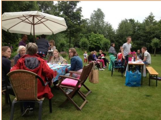
Jaarlijkse BBQ kinderen-ouders-broers en zussen in de tuin van de familie Von Reth

Groepsvorming is een essentieel onderdeel in het proces naar zelfstandig wonen. Elke maand komen de kinderen bij elkaar om samen te eten en wat gezelligs te doen bij een van de ouders. Een paar keer per jaar is er een weekend met de kinderen.