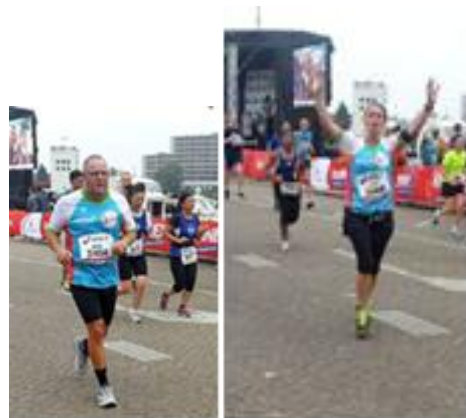
onze lopers van de Dam tot Damloop