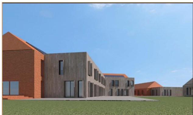
Impressie van het gebouw Ronse

De negen appartementen en de gemeenschappelijke ruimte zijn ondergebracht in het gebouw Ronse op de eerste verdieping. Het gebouw is op een duurzame manier ontwikkeld waardoor de energiekosten structureel laag zullen zijn. Tijdens het afgelopen jaar is er vrijwel maandelijks overleg geweest tussen onze werkgroep wonen en de bouwcoördinator van Glorieux en de architect Bo.2. Onderwerpen van overleg waren de afmetingen, inrichting en voorzieningen van de appartementen en de gemeenschappelijke ruimten. De planning is afgelopen jaren een paar keer aangepast omdat de