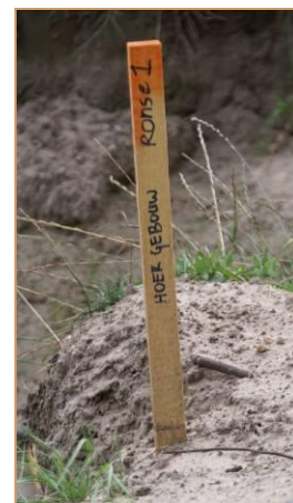
De 1 e paal...

afgegeven, maar er loopt nog wel een bezwaarprocedure van de omwonenden. De voorbereidingen van de bouw zijn al begonnen. De uitvoering start waarschijnlijk eind september of begin oktober. De bouw wordt uitgevoerd door Van der Maazen bouwgroep.